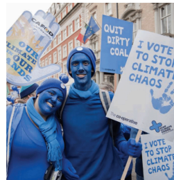
White, R. & Heckenberg, D. (2014). Green Criminology . Londres, Routledge.